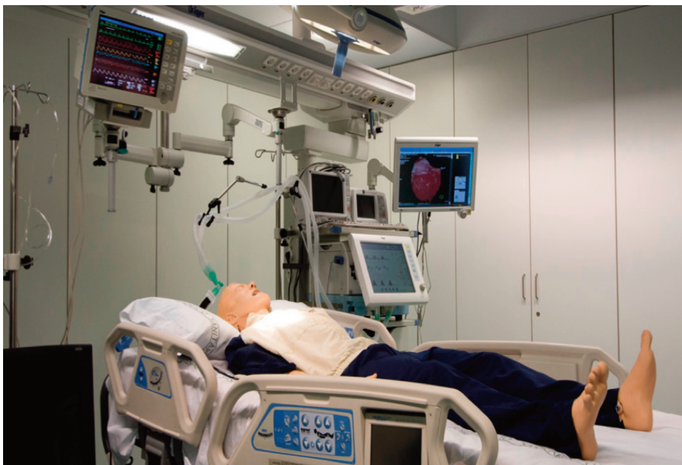
Laboratorio de Simulación Clínica. Universidad de Barcelona

Incluye un proyecto individual final que deberá defenderse públicamente ante el profesorado del equipo docente.